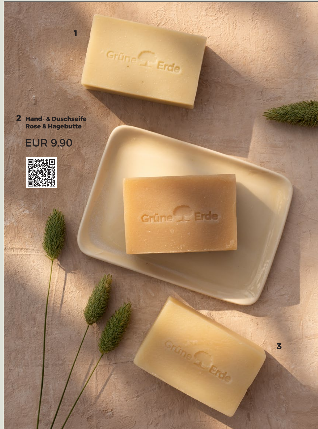
2 Hand- & Duschseife Rose & Hagebutte

Ökologische Verpackung: sinnvoll und praktisch auf Reisen